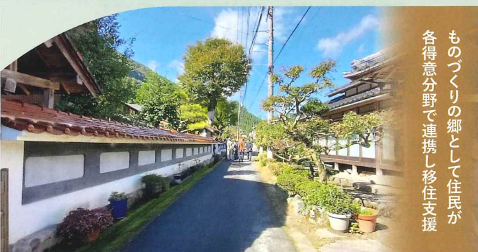
2023年度 住まいのまちなみ賞(一般社団法人 西郷工芸の郷あまじゃく)(鳥取県鳥取市)

※受賞団体には、30万円(1団体1年あたり)を 3年間、維持管理活動の推進の ために支援します