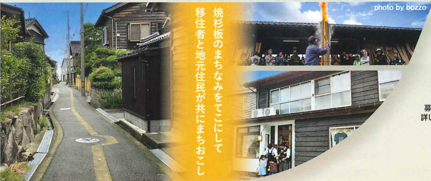
2023年度 住まいのまちなみ賞(特定非営利活動法人 たけのかぞく)(兵庫県豊岡市)