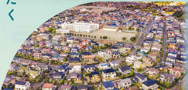
2023年度 住まいのまちなみ優秀賞(上郷ネオポリス自治会)(神奈川県横浜市栄区)