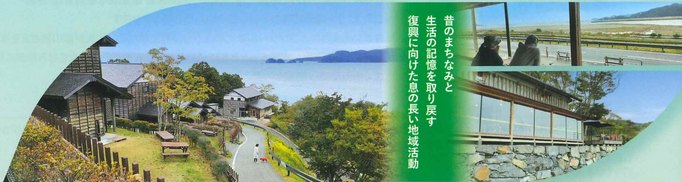
2023年度 国土交通大臣賞(特定非営利活動法人 りあすの森)(宮城県石巻市)