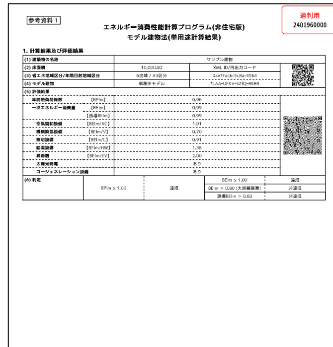
適判用と印字された計算結果 PDFファイルのイメージ