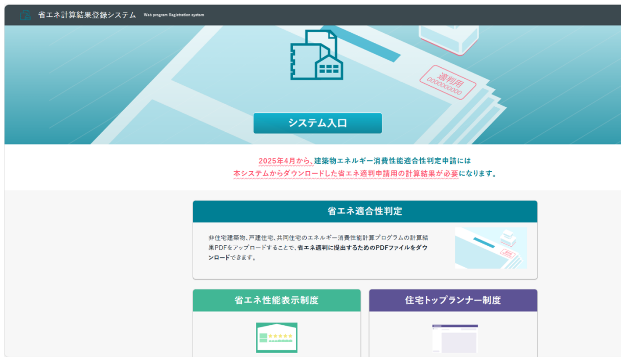
省エネ計算結果登録システムの トップページ

※ 予め、当該年度の供給住戸数が対象住戸数を上回ると見込まれる事業者による活用を想定しています。