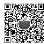
▲ブロック会議 詳細資料